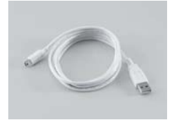
USBケーブル USB CABLE WHAYU JANコード4977766670937 オープン価格