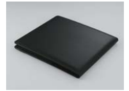
ソフトケース SOFT CASE JANコード4977766670913 オープン価格