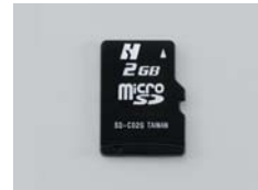
microSD™カード(2GB) MICRO-SD PACK JANコード4977766670944 オープン価格