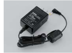
専用充電用ACアダプタ ADAPTER AD-S50 JANコード4977766670920 オープン価格