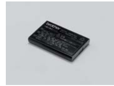
専用充電式リチウムイオン電池 BATTERY SV-100 JANコード4977766670906 オープン価格